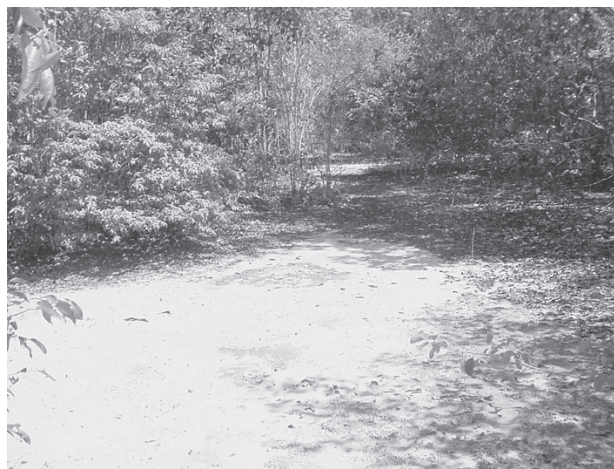
Figura 1 - Aspecto geral do ecossistema de campina da região da Confiança II, Município do Cantá, Roraima.