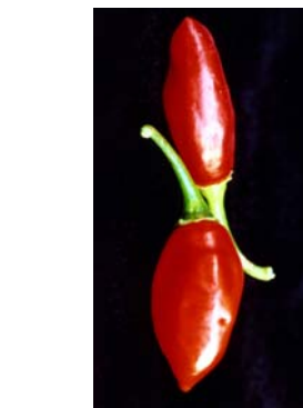
91 Capsicum chinense (no name) (2b) SOLANACEAE