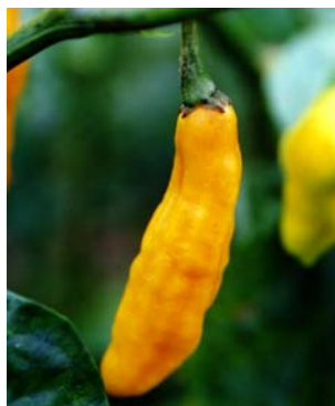
74 Capsicum chinense Pimenta amarela (1) SOLANACEAE