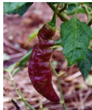
36 Capsicum chinense Pimenta Cheiro (Longa) SOLANACEAE