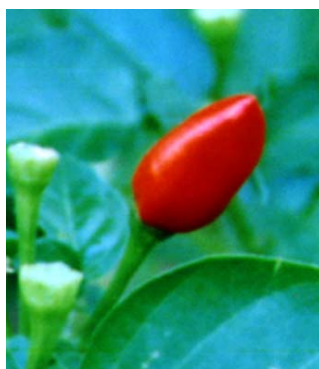
71 Capsicum chinense Ornamental SOLANACEAE