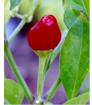
4 C. annuum var. annuum Pimenta de mesa SOLANACEAE