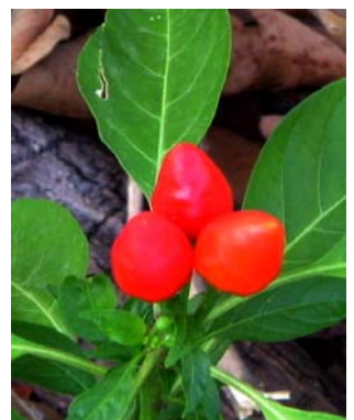
16 C. a. v. glabriusculum SOLANACEAE