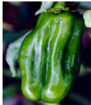
7 C. annuum var. annuum Pimentão comum SOLANACEAE