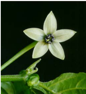
29 Capsicum chinense SOLANACEAE