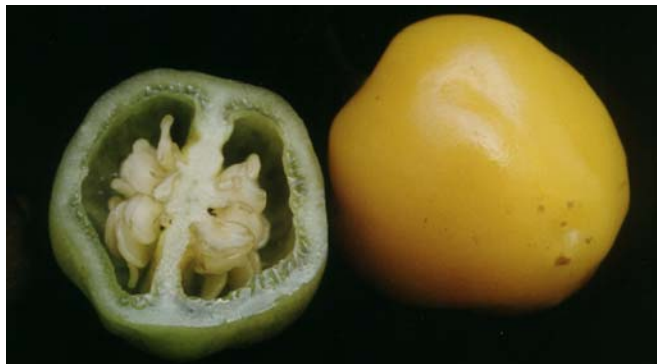
97 Capsicum chinense (no name) (3b) SOLANACEAE