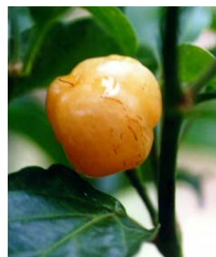
56 Capsicum chinense Murici (3) SOLANACEAE