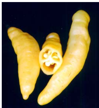
57 Capsicum chinense Murupi amarela (1) SOLANACEAE