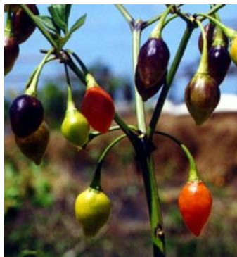
45 Capsicum chinense Chumbinho SOLANACEAE