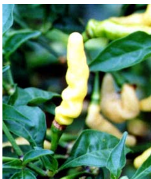
62 Capsicum chinense Murupi amarela (5) SOLANACEAE