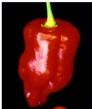
82 Capsicum chinense Pimenta doce (2) SOLANACEAE