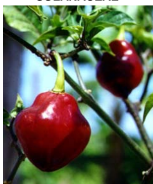
86 Capsicum chinense Pimenta rôxa SOLANACEAE