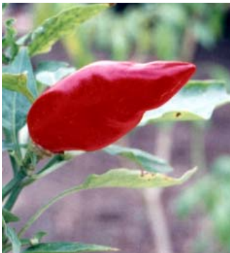
5 C. annuum var. annuum Pimenta de mesa SOLANACEAE