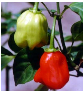
33 Capsicum chinense Canaimé (Wapichana) SOLANACEAE