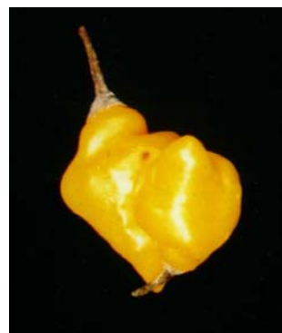
80 Capsicum chinense Pimenta de mesa SOLANACEAE