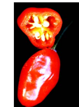
79 Capsicum chinense Pimenta de mesa SOLANACEAE