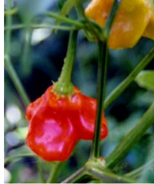
18 C. baccatum v. pendulum Chapéu-de-frade SOLANACEAE