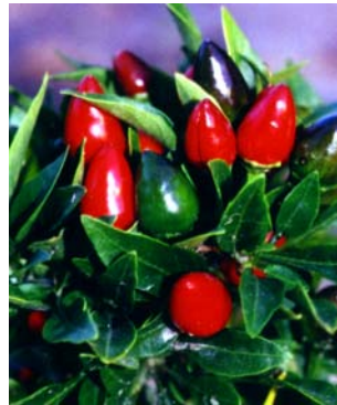
10 C. a. v. glabriusculum (1a) SOLANACEAE