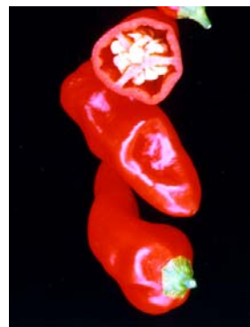
84 Capsicum chinense Pimenta doce (4) SOLANACEAE