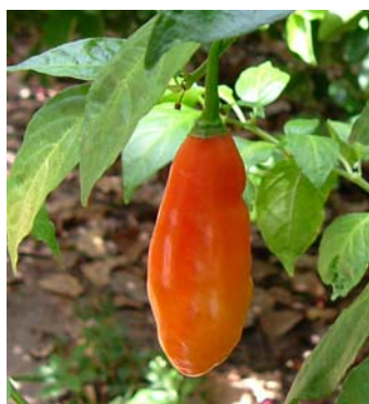
37 Capsicum chinense Pimenta cheiro vermelha (1) SOLANACEAE