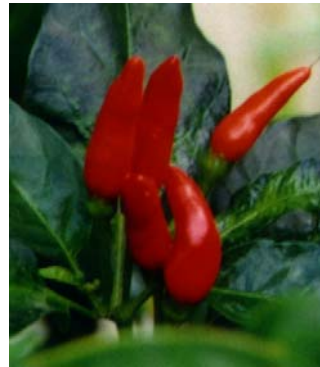
27 Capsicum frutescens Malaguetão (2a) SOLANACEAE