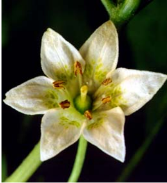
17 Capsicum baccatum var. pendulum SOLANACEAE