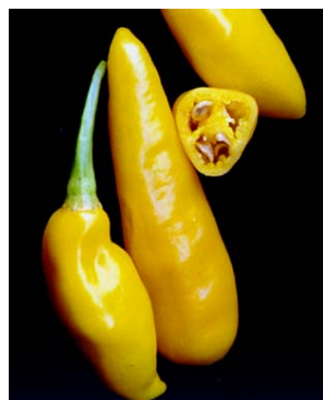
93 Capsicum chinense (no name) SOLANACEAE