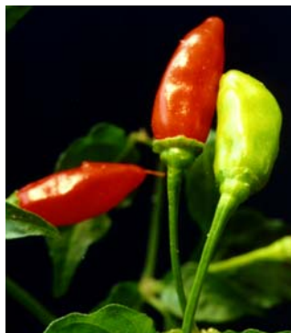
47 Capsicum chinense Malaguetão (1) SOLANACEAE