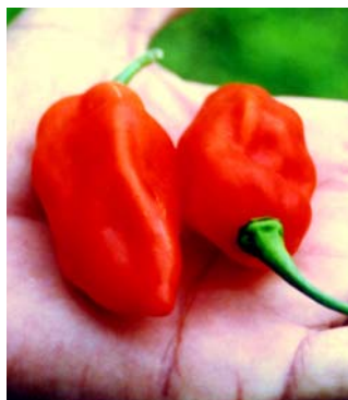
43 Capsicum chinense Pimenta cheiro vermelha (6) SOLANACEAE