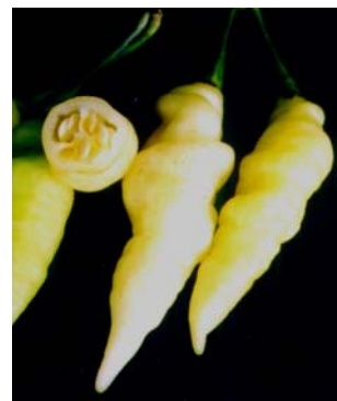
60 Capsicum chinense Murupi amarela (3b) SOLANACEAE