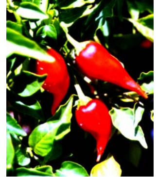
20 C. baccatum v. pendulum Unha-de-moça SOLANACEAE