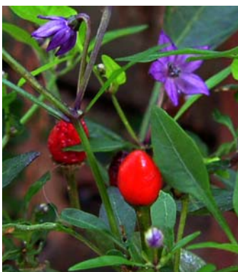
13 C. a. v. glabriusculum SOLANACEAE