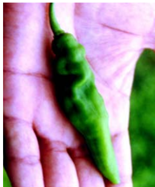
66 Capsicum chinense Murupi vermelha (3b) SOLANACEAE