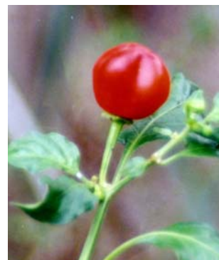
52 Capsicum chinense Moranguinho (1a) SOLANACEAE