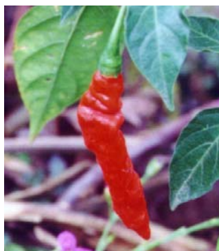
63 Capsicum chinense Murupi vermelha (1) SOLANACEAE