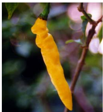
61 Capsicum chinense Murupi amarela (4) SOLANACEAE