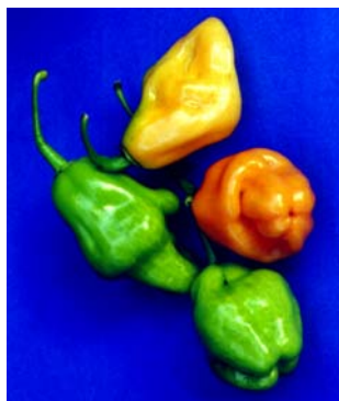
34 Capsicum chinense Pimenta cheiro (amarela) (1) SOLANACEAE