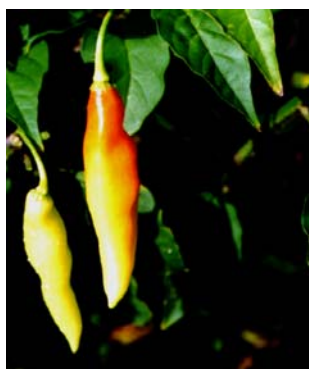
38 Capsicum chinense Pimenta cheiro vermelha (2a) SOLANACEAE