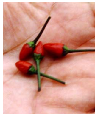
15 C. a. v. glabriusculum SOLANACEAE