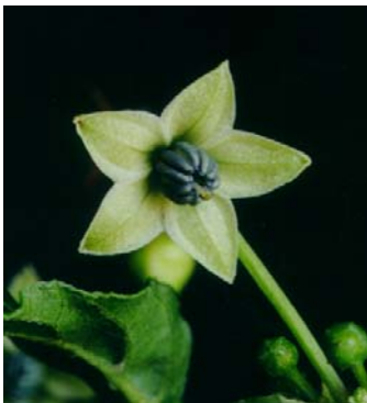
21 Capsicum frutescens (a) SOLANACEAE