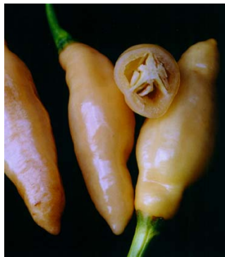
67 Capsicum chinense Murupi (falsa) SOLANACEAE