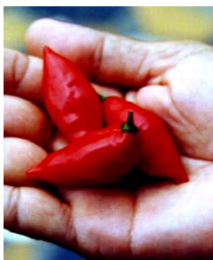
99 Capsicum chinense (no name) SOLANACEAE