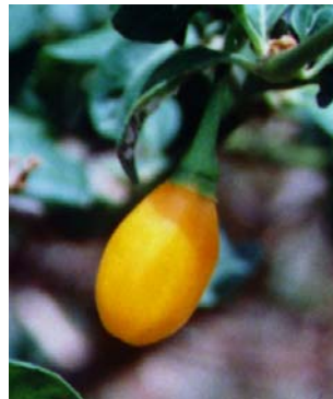
30 Capsicum chinense Ardosa amarela SOLANACEAE