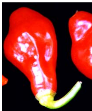
78 Capsicum chinense Pimenta de mesa (ardosa) SOLANACEAE