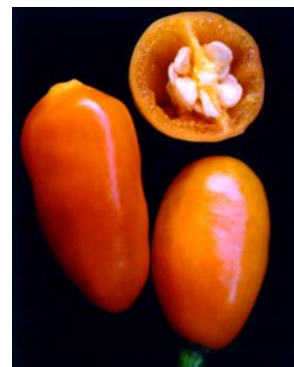
92 Capsicum chinense (no name) SOLANACEAE