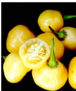
54 Capsicum chinense Murici (1) SOLANACEAE