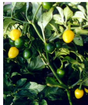
44 Capsicum chinense Cumari-do-Pará SOLANACEAE