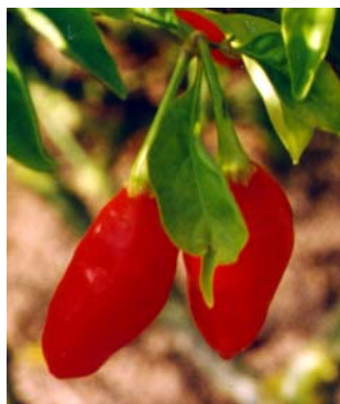
90 Capsicum chinense (no name) (2a) SOLANACEAE