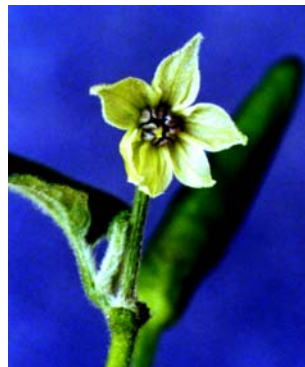
22 Capsicum frutescens (b) SOLANACEAE