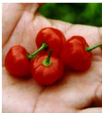
98 Capsicum chinense (no name) SOLANACEAE