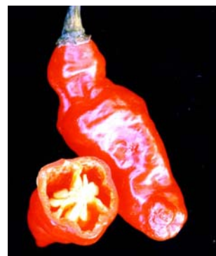
64 Capsicum chinense Murupi vermelha (2) SOLANACEAE