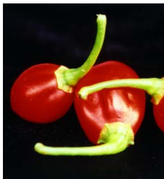
89 Capsicum chinense (no name) (1b) SOLANACEAE