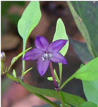
9 C. annuum var. glabriusculum SOLANACEAE