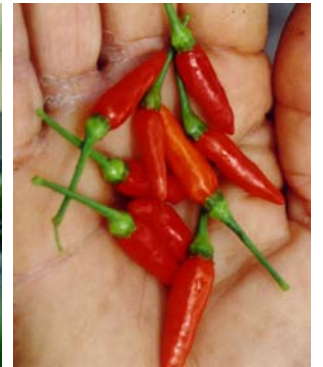
28 Capsicum frutescens Malaguetão (2b) SOLANACEAE