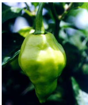
94 Capsicum chinense (no name) SOLANACEAE