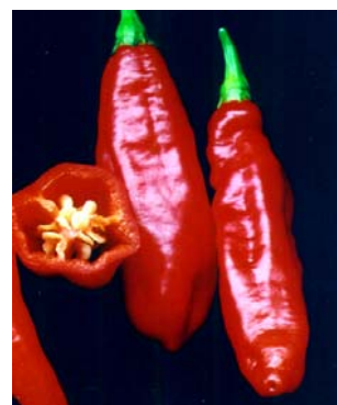
40 Capsicum chinense Pimenta cheiro vermelha (3) SOLANACEAE