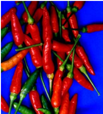
25 Capsicum frutescens Malagueta (1b) SOLANACEAE