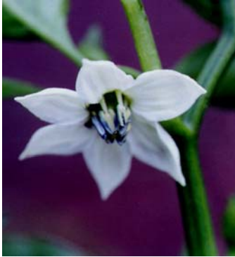
1 Capsicum annuum var. annuum SOLANACEAE

Reinaldo Imbrozio Barbosa – INPA ( reinaldo@inpa.gov.br ); Francisco Joaci de Freitas Luz – Embrapa ( joaci@cpafr.embrapa.br ); Herundino Ribeiro do Nascimento Filho – UFRR ( herundino@yahoo.com.br ); Cice Batalha Maduro – MIRR