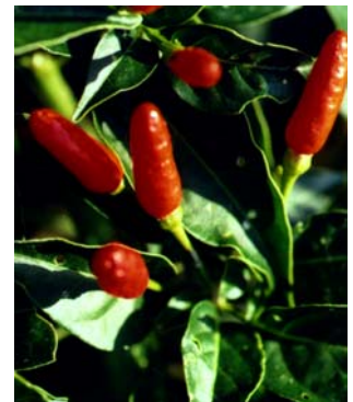
24 Capsicum frutescens Malagueta (1a) SOLANACEAE