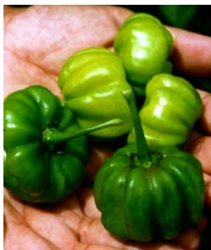
50 Capsicum chinense Morangão SOLANACEAE