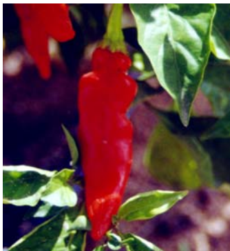
65 Capsicum chinense Murupi vermelha (3a) SOLANACEAE