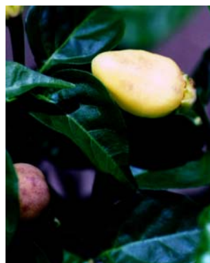
14 C. a. v. glabriusculum SOLANACEAE