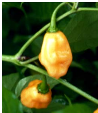
75 Capsicum chinense Pimenta amarela (2) SOLANACEAE