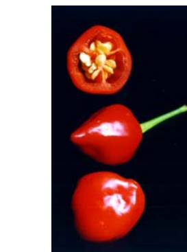
95 Capsicum chinense (no name) SOLANACEAE