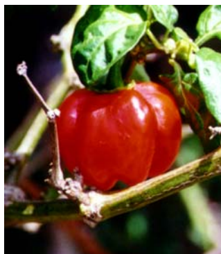
51 Capsicum chinense Moranga SOLANACEAE