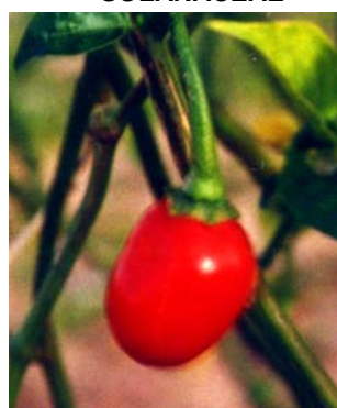
88 Capsicum chinense (no name) (1a) SOLANACEAE