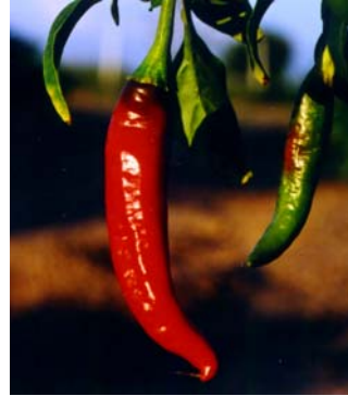
19 C. baccatum v. pendulum Dedo-de-moça SOLANACEAE