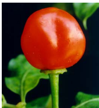
53 Capsicum chinense Moranguinho (1b) SOLANACEAE