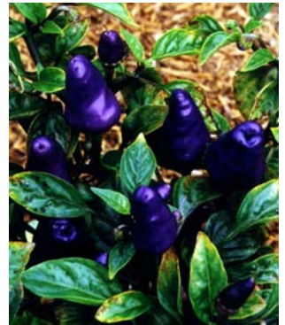
12 C. a. v. glabriusculum SOLANACEAE