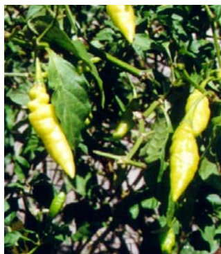
59 Capsicum chinense Murupi amarela (3a) SOLANACEAE