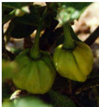
81 Capsicum chinense Pimenta doce (1) SOLANACEAE