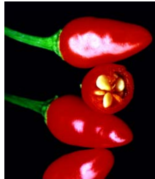
11 C. a. v. glabriusculum (1b) SOLANACEAE