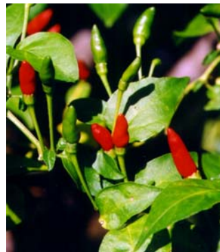
23 Capsicum frutescens Malagueta SOLANACEAE