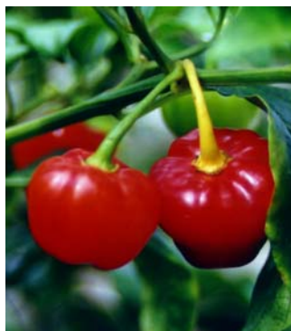
83 Capsicum chinense Pimenta doce (3) SOLANACEAE