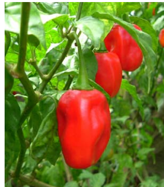
31 Capsicum chinense Canaimé SOLANACEAE