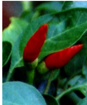
26 Capsicum frutescens Malagueta SOLANACEAE