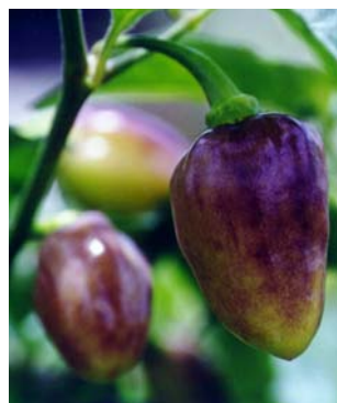
96 Capsicum chinense (no name) (3a) SOLANACEAE