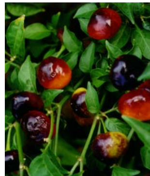
68 Capsicum chinense Olho-de-mutum (1a) SOLANACEAE