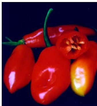
41 Capsicum chinense Pimenta cheiro vermelha (4) SOLANACEAE