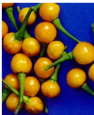
70 Capsicum chinense Olho-de-peixe SOLANACEAE