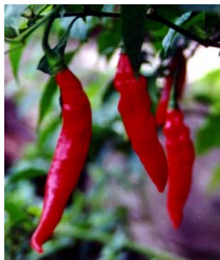
46 Capsicum chinense Esporão-de-galo SOLANACEAE