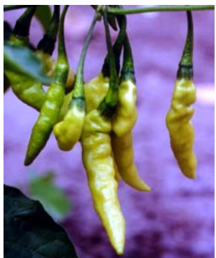
58 Capsicum chinense Murupi amarela (2) SOLANACEAE