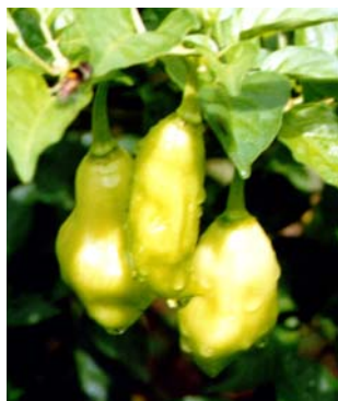
42 Capsicum chinense Pimenta cheiro vermelha (5) SOLANACEAE