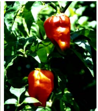
32 Capsicum chinense Canaimé (Patamona) SOLANACEAE