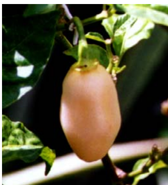
77 Capsicum chinense Pimenta cheiro (falsa) SOLANACEAE