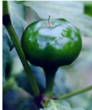
6 C. annuum var. annuum Pimentão bola SOLANACEAE