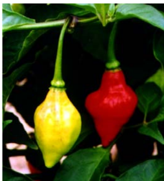
73 Capsicum chinense Peão-vermelho SOLANACEAE