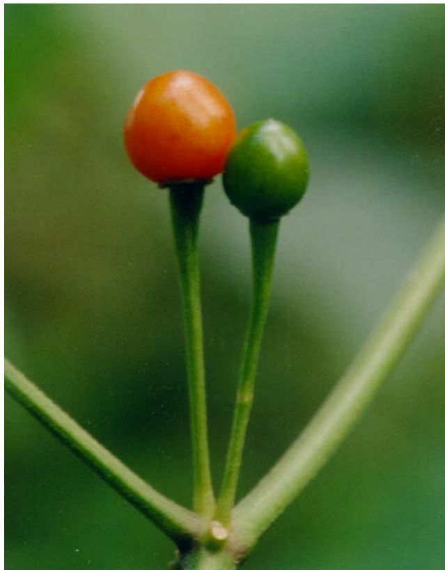
100 Capsicum chinense Wild pepper (Pimi'ro) SOLANACEAE