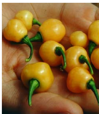
55 Capsicum chinense Murici (2) SOLANACEAE