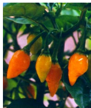
72 Capsicum chinense Peão-amarelo SOLANACEAE