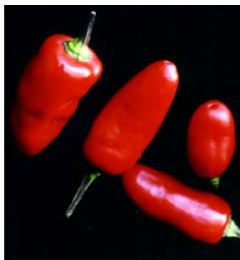
49 Capsicum chinense Malaguetão (3) SOLANACEAE