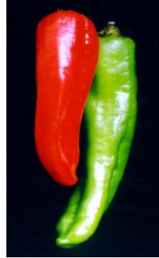
3 C. annuum var. annuum Pimentão americano (1b) SOLANACEAE