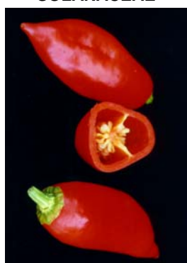
85 Capsicum chinense Pimenta vermelha SOLANACEAE