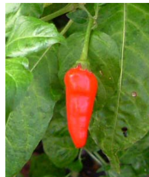
48 Capsicum chinense Malaguetão (2) SOLANACEAE