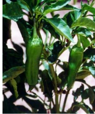
2 C. annuum var. annuum Pimentão americano (1a) SOLANACEAE