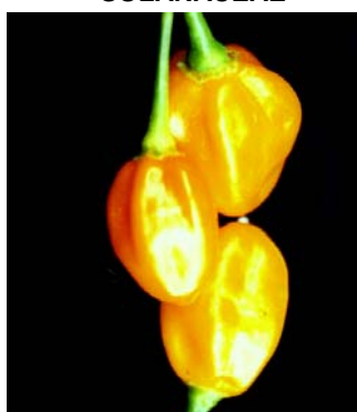
87 Capsicum chinense (no name) SOLANACEAE