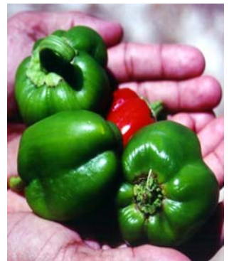
8 C. annuum var. annuum Pimentão indígena SOLANACEAE