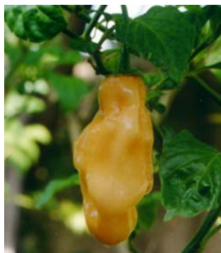
35 Capsicum chinense Pimenta cheiro (amarela) (2) SOLANACEAE