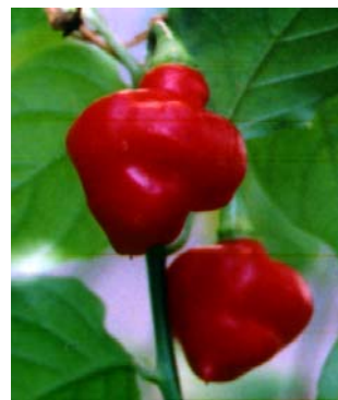
76 Capsicum chinense Pimenta cheiro (falsa) SOLANACEAE