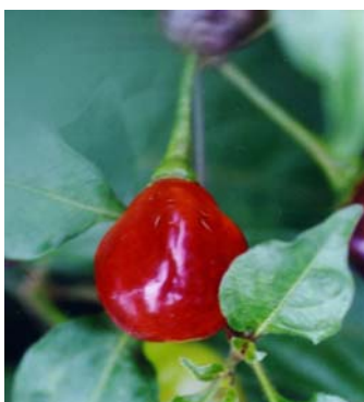
69 Capsicum chinense Olho-de-mutum (1b) SOLANACEAE