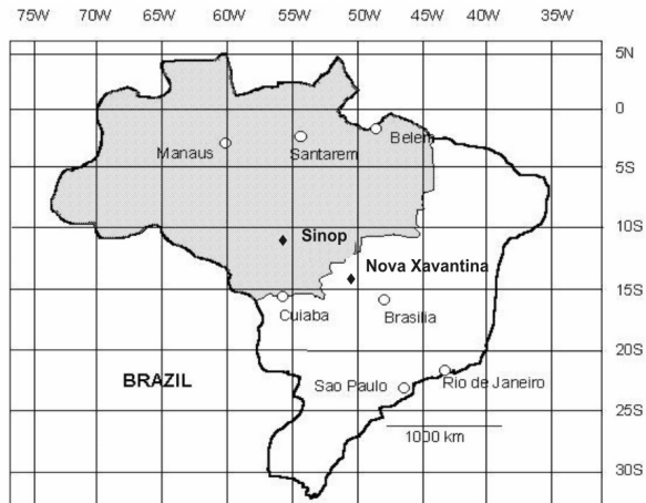
Figure 1 - Location of the study areas.

de serrapilheira em cada tipo de floresta. Para analisar as relações entre a umidade relativa, precipitação, temperatura e a produção de serrapilheira foi aplicada análise de correlação. A produção de serrapilheira das três áreas nos períodos de seca e chuvoso foi comparada pelo Teste t.